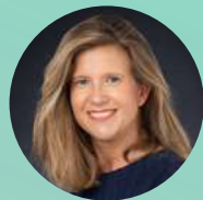
Vinca Bonduelle Lausanne